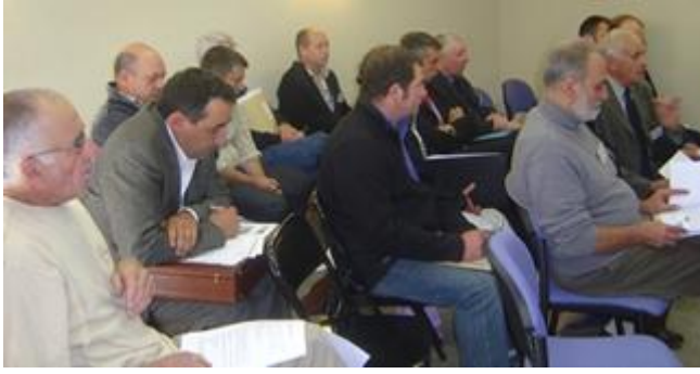
Couteliers, professionnels, institutionnels... liés aux dénominations "Laguiole" et "Aubrac" réunis pour un même combat