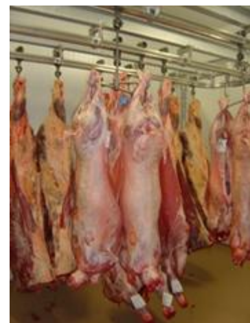
Viande stockée en chambre froide

Pierre Boscus participe de près à la vie économique locale. Il s'approvisionne en matières premières en Aveyron. Les bêtes sont sélectionnées directement dans les exploitations agricoles du plateau de Sénergues, de la vallée du Dourdou, et du Ségala pour les porcs lourds. L'abattage est assuré à Rodez pour les bovins, les ovins et les porcs et à Villefranche-de-Rouergue pour les porcs lourds. L'entreprise est fidèle aux fournisseurs locaux, du primeur aux producteurs maraîchers de la Vallée du Lot et aux fromagers régionaux... Pour la transformation du bâtiment acquis pour le transfert d'une part de son activité, Pierre Boscus a bien sûr fait appel aux entreprises locales. Un engagement qui se retrouve aussi au travers du sponsoring de l'équipe de cyclisme locale « Le Guidon Decazevillois », de clubs sportifs locaux et de voitures de rallye.